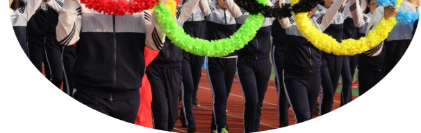
本版摄影 入场式(陈建初) 田径赛(团委、学生会提供)